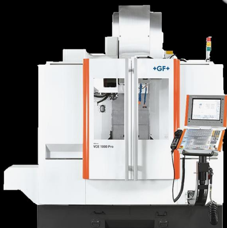
MIKRON VCE 1000 CNC megmunkáló központ