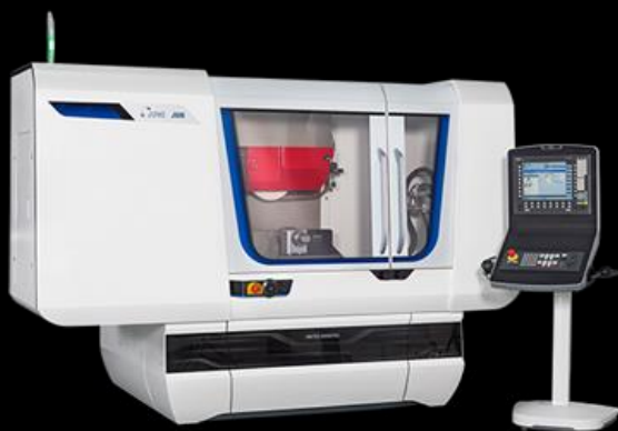
JUNG J600 sík- és profilköszörű