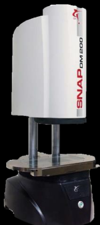
SNAP DM 200 mérőgép