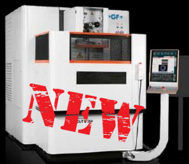
AgieCharmilles CUT E 350 huzalos szikraforgácsoló